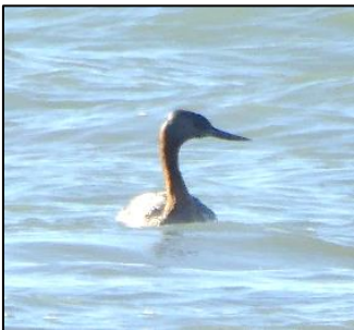
Gwyach fawr, sy'n anferth

Rhai o'r uchafbwyntiau adaryddol ar yr arfordir oedd: yr wyach fawr ( Podiceps major ) sy'n anferth ac yn gyffredin hyd y glannau; pedair math o fulfran; tair math o biden fôr (dwy ddu a gwyn oedd yn debyg iawn i rai Cymru, a'r drydedd, oedd yn uchel ar fy rhestr o adar i'w gweld tra 'mod i yma, yn ddu). Dim ond dwy fath o wylan, oedd hefyd yn dod i mewn i'r tir cyn belled â'r Gaiman, sef gwylan y de ( Larus dominicanus ) sy'n debyg iawn i'n gwylan gefnddu leiaf ni o ran maint ond â chefn du, a'r wylan