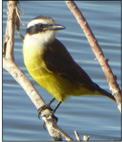
Y bol melyn yn Nhrelew

mwyaf trawiadol yw y ciscadî mawr ( Pitangus sulphuratus ) neu y 'bol melyn' fel mae'r gwladfawyr yn ei alw. Galwad uchel a thrawiadol, ond yn gwrthod yn lân imi ddod yn ddigon agos i gael llun. Trio a thrio dros dri mis a mwy i gael llun call, a dim ond llwyddo yn y diwedd ar ymweliad â Llyn Chiquichano ynghanol Trelew, lle mae'r adar wedi arfer yn well efo pobol.