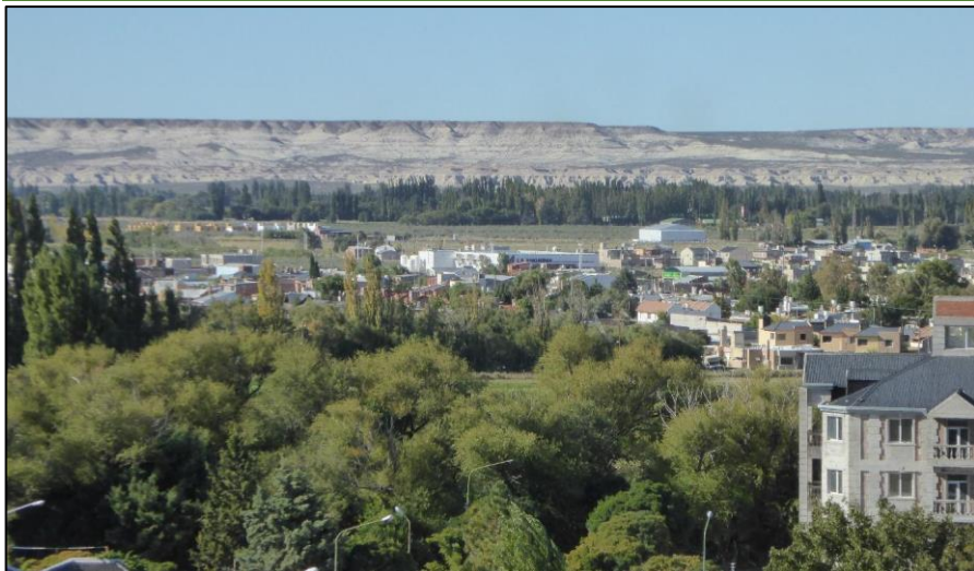
Golygfa dros ran o dre'r Gaiman, efo Bryn Gwyn (enw addas) yn y pellter