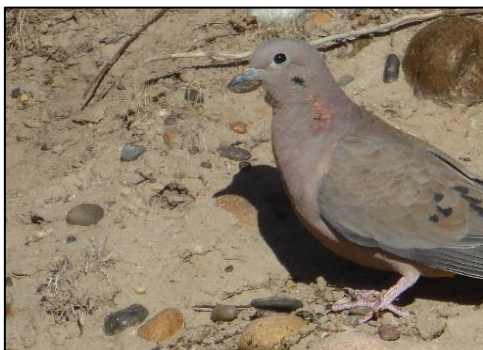
Y durtur glustiog