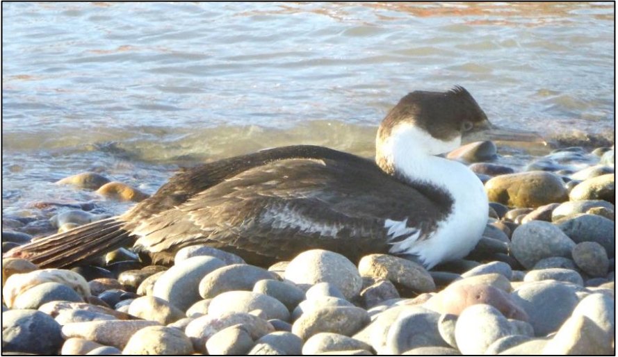
Mulfran Iygatlas (Phalacrocorax atriceps) yn gorffwyo ar draeth Playa Union

benfrown ( Chroicocephalus maculipennis ), sy'n cyfateb o ran maint a phatrwm i'n gwylan benddu ni.