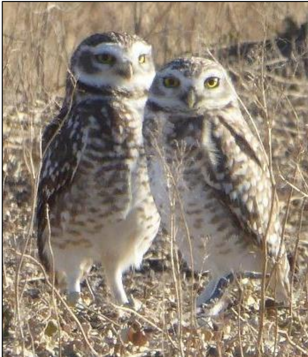
Pâr o dylluanod tyrchol

Rhyw hanner milltir o'r dref ar dir agored ger ffordd Dolavon, roeddwn wrth fy modd pan glywais gri rybudd fer y dylluan dyrchu ( Athene cunicularia ). A dacw nhw, pâr ohonynt yn sefyll ger hen dwll dulog (neu armadillo) yn bobian eu pennau o ochr i ochr ac i fyny ac i lawr, yn union fel ein dylluan fach ni adra.