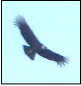
Un o'r ddau gondor pell a welwyd