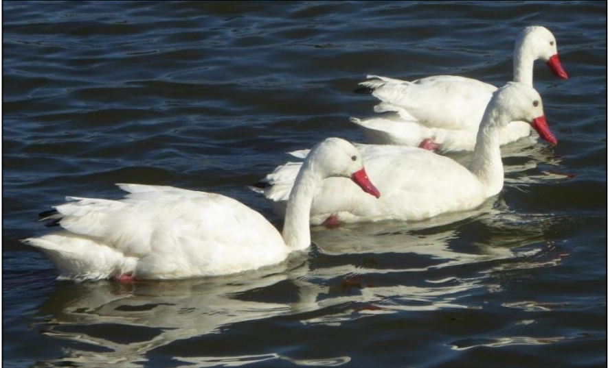
Elyrch coscobora, wedi eu henwi am eu galwad: 'cos-co-bora'

Am fod trafndiaeth gyhoeddus yn effeithiol iawn ac yn rhad iawn yn y dyffryn, roedd yn syniad da mynd am y diwrnod i Drelew. Yma ynghanol y dref, mae llyn mawr gafodd ei enwi ar ôl un o benaethiaid brodorol y Tehuelche. Mae llwybr hyfryd o'i gwmpas, ac mi welwch amrywiaeth dda o adar arno.