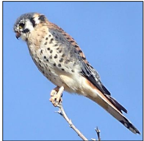
Cudyll coch America bychan