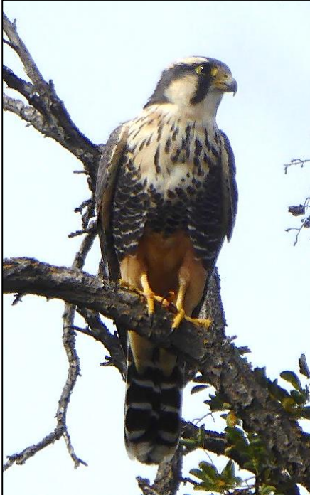
Hebog aplomado yn fwy chochaidd na'r tramor

Ceir sawl math o farcutiaid a gweilch yn hela ar y paith agored (eu gweld o'r car, ond dim llun); dau fath o hebog (y tramor a'r aplomado) yn hela colomennod ar glogwyni ochrau'r dyffryn, a chudyll coch America sy'n llai na'r un Cymreig ac yn fwy lliwgar.