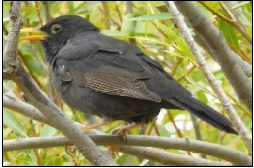
Y brych tsiguanco