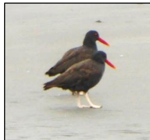
Braidd yn bell, ond dwy biden for dywyll ( Haematopus ater )