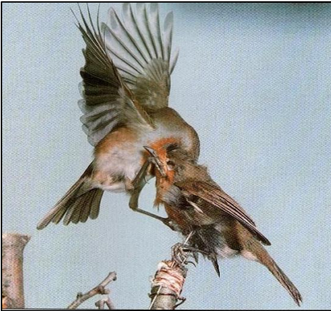
Robin yn ymosod ar robin wedi ei stwffio