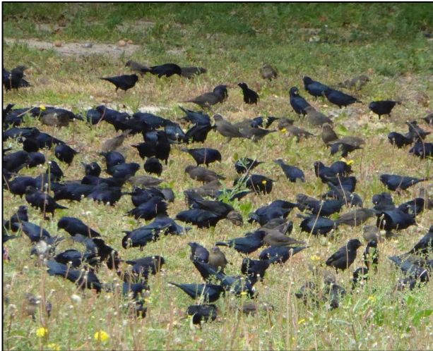
Adar gwartheg gloyw, yr ieir a'r cywion yn frown tywyll

ryw chwyrnu'n fygythiol arna'i, a dal ymlaen i chwilio am bryfetach yn y gwair. Yn y tymor nythu, mae gan hwn dagell ddu amlwg, fel tagell ein ceiliog buarth ni, a hynny sy'n rhoi ei enw iddo.