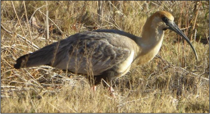
Yr ibis gyddfddu

ymyl un o'r camlesi ar lawr y dyffryn i geisio cael llun chwiwellod Magellan ( Anas sibilatrix ), dim ond eu tinau gefais i!