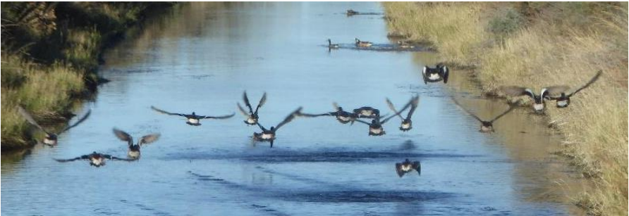
Chwiwellod Magellan braidd yn swil

ymyl un o'r camlesi ar lawr y dyffryn i geisio cael llun chwiwellod Magellan ( Anas sibilatrix ), dim ond eu tinau gefais i!