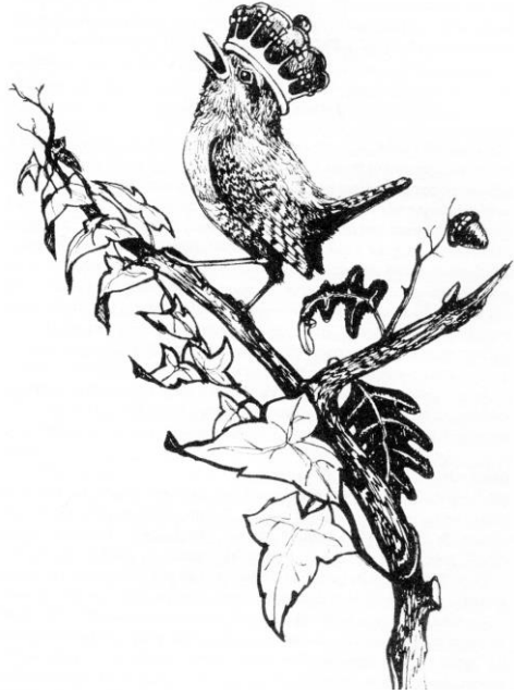
Y dryw - brenin yr adar

Mae straeon eraill yn dangos dylanwad Cristnogol wrth egluro pam fod gan y robin a'r wennol fron goch. Gwaed yr Iesu a syrthiodd arnynt wrth i'r adar geisio tynnu pigau'r drain o ben yr Iesu pan oedd ar y