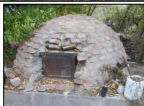
Hen bopty bara traddodiadol yn ardal Bryn Crwn

Yn ogystal â'r c'lorennod lled ddof oedd yn gyffredin yma, roedd sawl math o durtur. Un oedd y durtur glustiog ( Zenaida auriculata ) sy'n debyg o ran maint a lliw i'n turtur dorchog ni, gyda marc du bychan naill ochr i'w phen. Un arall yw'r durtur picui ( Columbina picui ) sydd yn un fechan iawn, tua maint bronfraith.