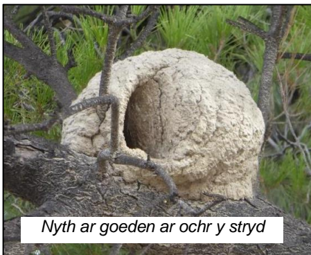
Nyth ar goeden ar ochr y stryd