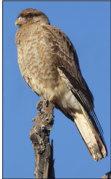
Y tsimango yn Llain Las

Un sy’n arbenigo ar gelanedd yw’r fwltur pengoch ( Cathartes aura ). Dyma aderyn mawr adain-lydan sy’n cylchu’n osgeiddig dros y tir. Mae ffermwyr yn hapus i’w gael am fod nifer o’r rhain yn medru clirio corff dafad mewn fawr o dro, gan gadw’r tir yn iach a glân –