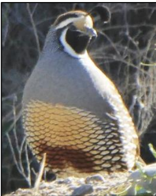
Ceillog soffliar California efo tusw ar ei dalcen