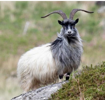
Un o drigolion y cwm