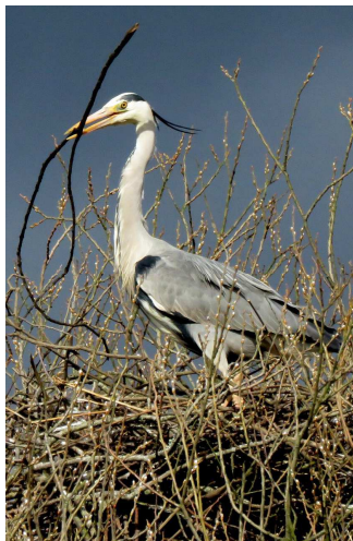
Adeiladu nyth