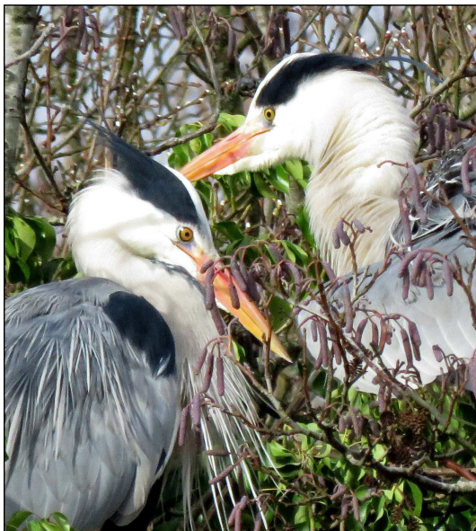
Dechrau Ionawr

Ac felly y bu hi eleni... ddechrau Ionawr,