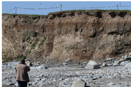
Gwenoliaid y glennydd

Roedd rhai ugeiniau o'r wenoliaid bach ar ffens uwchben y clogwyn ac ugeiniau eraill yng nghegau eu tyllau nythu ar y clogwyn a llawer mwy ar eu hadain. Bob hyn a hyn roedd y cwbl yn codi i'r awyr a chwyrllïo uwch y traeth a dod reit uwch ein pennau cyn dychwelyd at y clogwyn. Buom yno, heb fynd yn rhy agos i darfu ar yr adar, am tua hanner awr yn