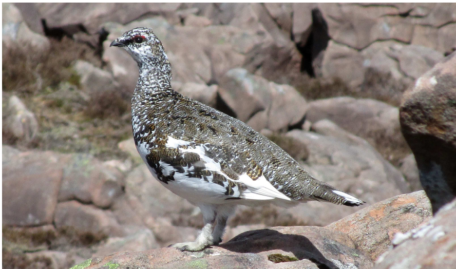
Grugiar yr Alban

Mynyddoedd trawiadol ardal Torridon ddenodd aelodau Clwb Mynydda Cymru i Ogledd yr Alban, ac am wythnos sych a braf wnaeth y rheiny ddim siomi. Pleser ychwanegol oedd nifer yr adar y daethom ar eu traws. Un o'r uchafbwyntiau oedd grugiar yr Alban, aderyn nad yw i'w weld ond ar y llechweddau yn y gogledd pell. Daethom ar ei draws sawl tro, yn rhyfeddol o ddof ac yn ddigon parod i dynnu sylw ato ei hun gyda'i alwad cras. Yn ystod y gaeaf mae'r plu yn wyn heblaw am y cynffon du, fel cuddliw yn yr eira, ond erbyn y gwanwyn a'r haf mae'r cefn a'r fron wedi tywyllu (fel yn y llun uchod).