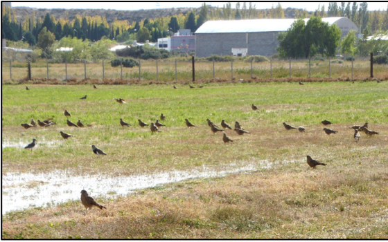
Tsimangos a dwy gornchwiglen

un o'u hoff safleoedd i giniawa. Ac ydynt, mae adar to Ewropeaidd yn frith drwy'r dref.