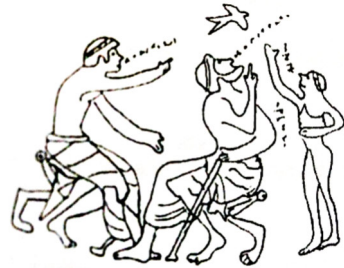
Darlun ar ffiol Roegaidd