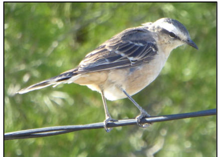
Y gwatwarwr aelwyn

bychain. Mae'n aelod o deulu'r hebogiaid ( Falconidae ) wedi'r cyfan, er nad yw ei adenydd yn flaenafain fel mwyafrif y teulu hwnnw. Gwelais rai yn pluo a bwyta adar to ar ben polyn letrig yn y Gaiman. Roedd pen gwastad polyn letrig yn amlwg yn