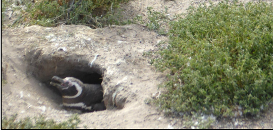
Oedolyn, neu gyw wedi gorffen bwrw'i blu