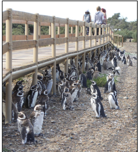
Cysgodi dan un o'r pontydd troed

Roedd llwybrau penodedig i'w dilyn, a nifer o bontydd troed, ryw 4 troedfedd o uchder, i'w croesi dros be oedd yn amllwg yn draffyrdd pengwiniad yn y prif dymor nythu. Byddai'r llwybrau hyn yn brysur iawn, wrth i un rhiant ddod o'r môr efo llond bol o bysgod i'r cywion, a'r rhiant arall fu'n eu gwarchod yn mynd, bob yn ail, i nôl mwy. Wrth lwc, doedd y pontydd ddim yn amharu o gwbl ar y traffig bwydo, ac erbyn hyn yn