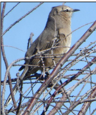
Gwatwarwr y paith

Adar cyffredin iawn drwy'r ardal yw'r gwatwarwyr ( Calandria yn Sbaeneg) sy'n aelodau deheuol o deulu'r mocking bird Americanaidd. Roedd dau fath ohonynt: y gwatwarwr aeliog ( Mimus saturninus ) oedd yn fwy o faint ac yn niferus yn y dref a'r cyffiniau, a gwatwarwr y paith ( Mimus patagonicus ) oedd yn llai a mwy