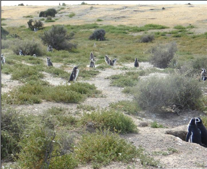
Golygfa gyffredinol dros y nythfa