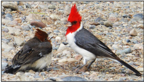
Cardinal criboch yn bwydo cyw

ji binc, efo pen a chrib goch lachar a chefn llwyd yn pigo hadau dan y coed. Hwn oedd y mwyaf lliwgar a thrawiadol welais o adar y Gaiman, ac mae'n rhaid ei fod yn ddigon effro a sgut i ddiflannu i lwyni trwchus pan ddeuai tsimango heibio.