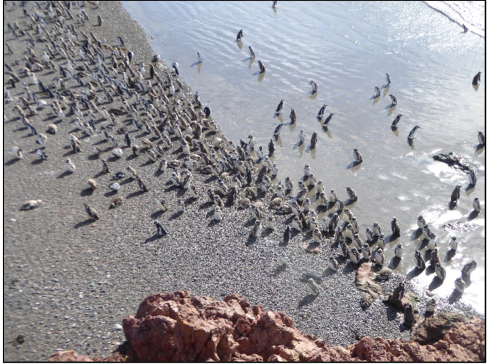
Ar lan y dŵr yn meddwl am fynd

Roedd yn ddiwrnod poeth, a'r cywion yn gorweddian neu sefyllian yn gysglyd yn y cysgod i arbed egni. Fydden nhw ddim yn cael