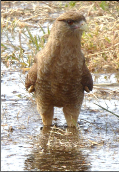
Tsimango yn y llain oedd yn cael ei dyfrio

caracara tsimango ( Milvago chimango ). Hwn yw'r lleiaf o'r teulu ac roedd i'w weld yn hedfan yn bwrpasol, mewn llinell syth dros y paith, gan ddangos clytiau golau yn agos i flaen pob adain ac ar ochr ucha'r gynffon. Y tsimango yn debyg o ran ei liw i'n bwncath ni ond ychydig llai o faint, a'i adenydd 'chydig yn gulach gyda blaenau gweddol grwn. Golyga hynny ei fod yn dal ei brae drwy ystwythder ei ehediad yn hytrach na chyflymder. Roedd ei fwydlen, fel ein bwncath ni, yn eitha' amrywiol – adar bach, pryfetach a chelanedd.