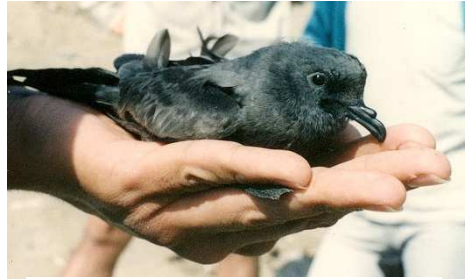
Un bychan ydi o, yn ffitio ar gledar llaw. Sylwch ar y tiwb trwyn nodweddiadol.

Pan fyddai Lockley yn gafael mewn pedryn, byddai'r aderyn yn ddiethriad yn poeri hylif olewaidd arno. Cynnyrch deietegol sy'n crynhoi yng nglasog yr aderyn yw'r hylif hwn a bydd yn troi'n fraster, maes o law. Wrth storio'r hylif yn ei stumog, mae gan y pedryn gronfa barhaol o fwyd a fydd yn caniatáu iddo fynd heb fwyd am ddyddiau, os bydd angen – er enghraifft, pan fydd yn gori neu pan