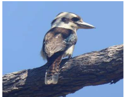
.... ac mi oedd raid cael llun o'r Cwcabyra, yndoedd?

na'n siglen fraith ni, oedd yn neidio yma ag acw i ddal pryfid ac yn siglo ei gynffon yn gyson – ond ddim i fyny ac i lawr fel ein siglen ni ond o ochr i ochr 'fatha ci! Wel roedd o'n ddoniol.