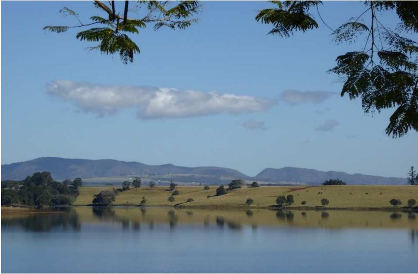
Yr olygfa dros Lyn Tinaroo – tebyg i adre, efo gwartheg duon yn porri (y dotiau ar y dde)

Awstralia, medda nhw, ydi'r unig le sy'n wlad, yn ynys ac yn gyfandir yr un pryd. Mi alla' inna' dystio i sicrwydd ei bod yn gythra'l o wlad fawr fel y gwelais i pan e's i yno am ddeufis yr haf 'ma (2014). Fy anrheg ymddeoliad i mi fy hun oedd y trip ac, wrth lwc, mi oedd gen i le i aros efo teulu yng Nghwïnsland a chyfaill yng Nghanberra. Doeddwn i ddim wedi gwneud unrhyw gynllun o flaen llaw o be o'n i am wneud yno. Mi oedd yn well gen i jyst dilyn fy nhrwyn a chymryd cyngor rhai sy'n gyfarwydd â'r lle ar ôl cyrraedd. Felly bu hi, a heblaw am dridiau ar drip twristaidd i'r 'canol coch' i weld Uluru (y graig fawr goch honno yn yr anialwch) a diwrnod ar y Barrier Reef, felly bu hi.