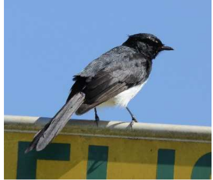
Y sigl-di-gwt, neu Willie Wagtail

Onnd fy ffefryn, ac fe arhosodd hwn yn ffefryn imi drwy'r holl daith, oedd y 'sigl-di-gwt' neu Willie Wagtail (cynffon-daenwr Llathraidd, Rhipidura leucophrys ). Deryn bach bywiog du a gwyn, ron' bach mwy