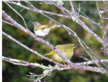
Melysor diaddurn (y bychan) yn dwrdio'r melysor melyn oedd yn tresmasu ar ei diriogaeth. Un blodyn Grevillia oedd ar y llwyn hwn.

Mi welais i 20-30 o felysorion o sawl rhywogaeth yn meddiannu coeden gym fawr. Pob un yn amddiffyn tiriogaeth oedd efallai cyn lleied a rhan o gangen ac yn cynnwys ryw ddwsin neu fwy o flodau. Fel y gallwch feddwl, mi oedd y ffræo a'r cecru rhwng yr adar bach bywiog 'ma yn anhygoel. Y mathau bychain yn amddiffyn yn ffyrnig rhag eu cymdogion ac yna'r rhai mwy (yn rêl bwllis) yn symyd fel a fynon nhw o un cangen i'r llall gan achosi helbul a'r rhegi mwya' ofnadwy ymysg y rhai bychain.