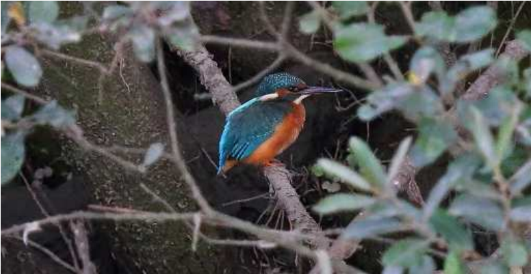
Yn dilyn y cyfnod nythu, tynnwyd y llun hwn o'r "glas" yn ei gynefin ar lannau'r Ddwryd

awdurdodau y Parc ac â Chyfoeth Naturiol i'w hysbysu am y nyth gan eu rhybuddio i adael y gwaith nes i'r cyfnod nythu basio.