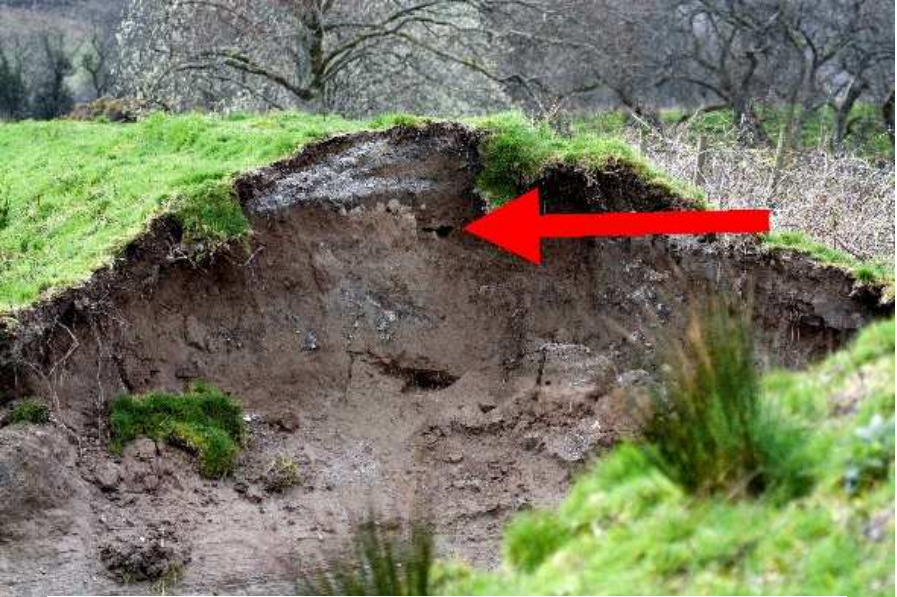
Y bwlch yn y clawdd llanw – gyda'r saeth yn dangos lleoliad y nyth

Yn ystod storm enbyd Chwefror 12fed eleni, fe ddrylliwyd y clawdd llanw sy'n diogelu caeau dyffryn Maentwrog oddi wrth yr Afon Ddwryrd. Dros nos, fe ymddangosodd bwlch o rhyw 5 metr ynddo. Yr oedd ochr y bwlch fel pe tae wedi ei dorri â chyllell gyda 'wal' o bridd yn y golwg.