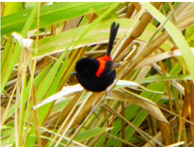
Dryw cefngoch yn yr hesg

Awst 15fed – wrth fynd am dro bora 'ma dwad ar draws haid fechan o'r dryw cefngoch ( Malurus melanocephalus ) yn gweithio'u ffordd drwy'r gwair a brwgaitsh ar ochr y ffordd. Wel am betha bach del, bywiog a phrysur.