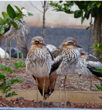
Fel 'sentris' ar y border

Un arall gafodd ei enwi'n lleol am ei alwad yw'r 'cyr-liw' (tewlin y gwylltir, Burhinus grallarius ). Yn aml byddai criw o'r rhain yn eistedd yn un rhes o dan ffens goed yn y cae gerllaw. Droeon eraill mi ddeuant i sefyll ar eu coesau hirion fel sentris yn y borderi o gwmpas yr ardd – gan aros yn hollol ddi-symud am amser hir.