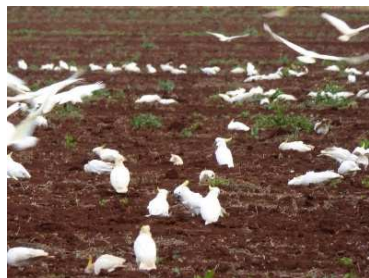
‘Cocis’ fel cawod eira ar y sofr