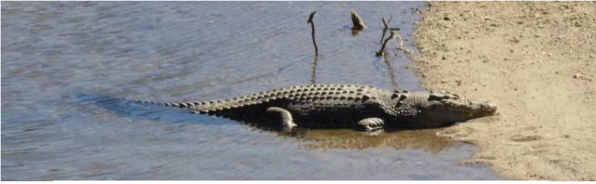
Y 'Saltie' mawr ar lan yr afon

Lakeland i gael golwg ar chwarel ola Buck, y Butcher's Hill Quarry. Roedd o newydd werthu hon ac ymddeol ryw fis ynghynt ond roedd o am ei dangos i ni a gwneud yn siwr fod y gath yn iawn, sef cath y swyddfa a'r barics. Mae'n debyg fod ganddo hiraeth ar ôl pws ac mi oedd hi yn falch o'i weld o, yn enwedig pan aeth i nol tun bwyd.