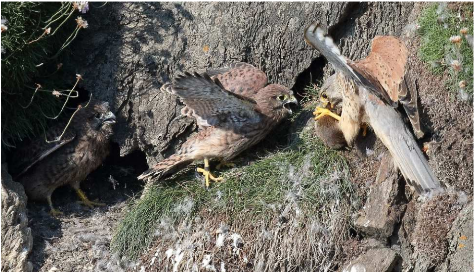
Y ceiliog yn dod â llygoden i'r cywion