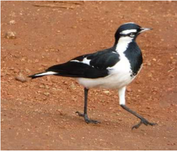
Y 'pi-wi' piwis