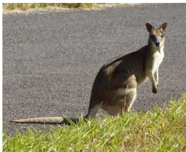
Weli di walabi?

Awst 8fed – wrth fynd am dro bora ’ma dwad ar draws fy walabi cynta ac, wrth iddo sboncio’n braf drwy’r gwair hir a’r drysni, gweld pa mor berffaith oedd y dull yma o symyd drwy gynefin o’r fath. Roedd o’n mynd sbonc-sbonc-sbonc tra byddai dingo, dyn neu gi yn gorfod stryffaglo cymaint drwy’r drysni nes y byddai’n amhosib codi digon o gyflymder i’w ddal o.