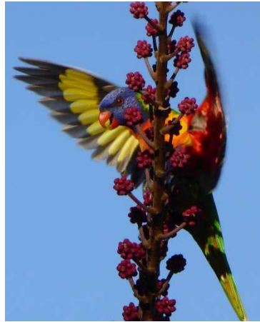
Y loriciât seithliw ( Trichoglossus haematodus )

Awst 6ed – ryw chydig lawr y ffordd yng nghefn y tŷ roedd clwstwr o goed gym (ewcalyptws) tal ac i fan’no y deuai heidiau swnllyd o gocatws mawr gwyn a loriciâts lliwgar i f’yta hadau. Roedd y rhain yn adar swil iawn ac mi fu raid imi aros am rai wythnosau cyn cael lluniau da. Pam y swildod? Mae’r adar yma, y ‘cocis’ yn arbennig, yn medru bod yn bla ac yn ddinistriol iawn i gnydau a hydnoed i dai pobl. Swil cyfrwys felly, am fod pobl yn eu herlid.