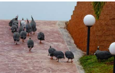
Y Snake Patrol yn gadael yr ardd un bore