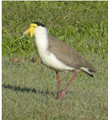
Ein cymydog, y cornicyll mygydog

Awst 4ydd – Wnes i ddim deffro tan ganol y bora. Cyfle yn y p'nawn i gyfarwyddo efo'r adar cyffredin o gwmpas y tŷ ac ar lannau'r llyn. Un oedd y cornicyll mygydog ( Vanellus miles ) oedd yn rhodio'r gwellt-tir ar lannau'r llyn. Grant yn dweud fy mod yn lwcus nad oedd yn dymor nythu am fod hwn yn ymosod ar unrhyw un ddaw'n agos. Mae ganddo sbardun heger ar ei arddwrn ac fe ddaw'n gyflym o'r tu cefn gan roi celpan ichi ar eich pen a thynnu gwaed.