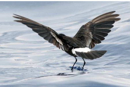
Pedryn drycin yn 'cerdded' ar y dŵr

Bachigyn yr enw 'Pedr' yw 'pedryn', ac mae'n gysylltiedig â'r hanesyn yn y Beibl am Pedr yn 'cerdded' ar fôr tymhestlog Galilea. 'Cas gan longwr' yw enw arall arno, ac adlais yw hynny o'r goel ymysg llongwyr bod pedrynod drycin yn rhagfynegi tywydd garw. Mewn oesau a fu, credid mai disgwyl i'r morwyr foddri yr oeddynt, wrth ddilyn eu llongau, er mwyn herwgipio eu heneidiau a'u trawsnewid yn bedrynod!