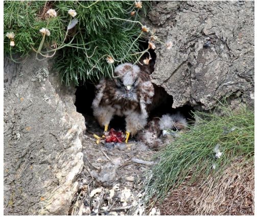
Gwledda ar aderyn

yno i fodrwyo y cywion yn ogystal â chywion mulfrain gwyrdd a nythai gerllaw.