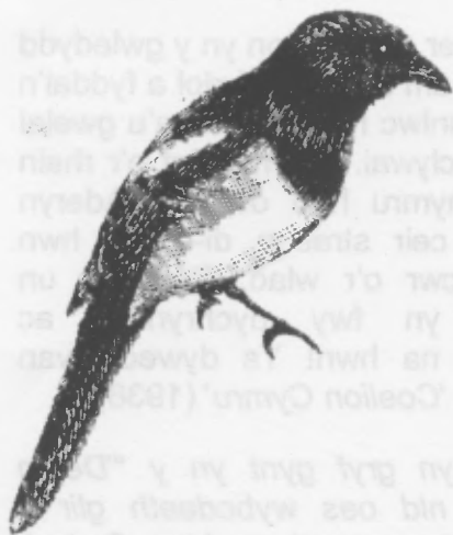
Llun - Chandler B. Beach, The New Student's Reference Work for Teachers Students and Families (Chicago: F. E. Compton and Company, 1909)

Piogen wen, piogen ddu; Lwc i mi! ptw! (h.y. poeri eto!) Cofiwch wneud hynny y tro nesa y gwelwch chi un bиден rwan – neu difaru wnewch chi!