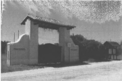
Y porth i'r warchodfa

Yn ymestyn am bellter o tua 6 milltir i'r dwyrain o farina fawr Vilamaura mae 'na strimyn hir o welyau cyrs trwchus a thir amaethyddol sydd wedi ei ddynodi yn barc amgylcheddol llawn amrywiaeth ( Parc Ambientale Vilamaura ). Dwi wedi cael pleser mawr yn crwydro hwn, er ei fod yn golygu teithiau hir mewn gwres llethol, gan ddilyn fy nhrwyn a mynd ar goll sawl gwaith am nad oes ffiniau amlwg na map call o'r lle ar gael.