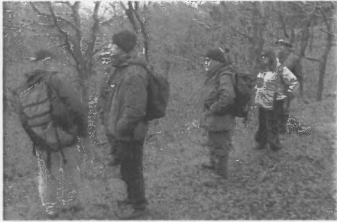
Welsoch chi'r llwynog 'na hogia?

un anodd i'w weld yn ei gynefin ym mrigau ucha'r coed.