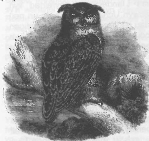
Llun - S. G. Goodrich Animal Kingdom Illustrated Vol 2 (New York: Derby & Jackson, 1859)

eto a marwolaeth a drygioni. Yr oedd hyd yn oed y genedl honno sy'n enwog am eu dewrder - yr Apache - yn ystyried mai'r dylluan oedd y mwyaf dychrynlyd o holl greaduriaid y byd.