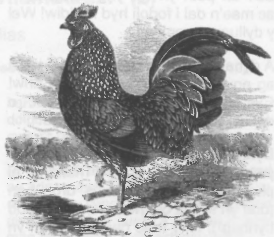
Llun - S. G. Goodrich Animal Kingdom Illustrated Vol 2 (New York: Derby & Jackson, 1859)

Gall adar dof fod yn anffodus hefyd - 'Na chad o gylch dy dy Gath wen na cheiliog du' meddai'r hen ddywediad ynte?