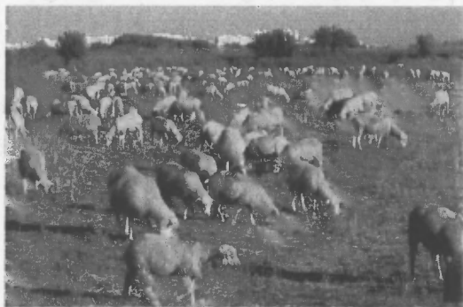
Defaid yn pori'r sofr

Roedd y defaid yn dilyn eu harweinydd – dafad fawr hefo cloch am ei gwddw – ac wrth iddyn nhw deithio'n hamddenol redden nhw'n 'styrbio pryfed a sboncod gwair. Ac yn barod i fanteisio ar hynny roedd creyrod y gwartheg, tua 20 ohonynt, wedi eu gwasgaru ymysg y praidd. Roedd y rhain yn amlwg yn cael helpa dda wrth gyd gerdded â'r defaid oherwydd roedd eu pigau'n saethu allan i ddal ryw sboncyn druan bob hyn a hyn. Mae'r creyr y gwartheg yn debyg iawn i'r creyrod gwyn ddaeth mor gyfarwydd inni yng Nghymru yn y 10 mlynedd ddiwethaf ond mae eu pig yn fyrrach ac yn felyn, gyda chyffyrddiad o felyn ar blu'r pen a'r frest a choesau llwyd-felyn. Fe ymgartrefodd un o'r rhain yn Abergwyngregyn ganol gaeaf 1980 ac roedd o i'w weld yno o'r ffordd fawr am ryw ddeufis yn y cae, hefo'r gwartheg.