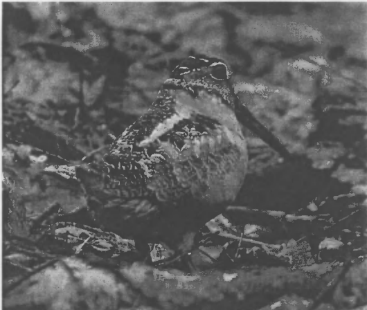
Jamestown Audobon Centre

Yr adeg gorau i weld ein cyffylodog brodorol yw nosweithiau golau'r gwanwyn, yn arbennig pan fydd y lleuad yn llawn ac yn goleuo'r ffurfafen rhyw ychydig bach – wel digon i'n llygaid ni beth bynnag. Dyma'r adeg y bydd yr adar yn mynd at i rodio ymylon y coedwigoedd ble byddant yn magu. Ar yr adeg hon o'r flwyddyn, gellir gweld eu hamlinell yn glir yn erbyn yr awyr ar noson braf, a chlywed y sain annaearyl y byddant yn ei wneud i ddatgan eu tiriogaeth. Nid cân yw hon, ond yn hytrach swm arbennig y mae'r plu yn eu gwneud wrth i'r aderyn 'ddawnsio' yn yr awyr i ddenu cymar. Â rhai mor bell a dweud y gellir amseru'r rhodio hwn i ddau funud wedi'r machlud, mor rheolaidd y weithred yn ystod ei thymor!