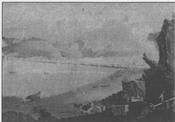
Y Cob, tua 1810

Ar fyr rybudd iawn y galwyd pobol at ei gilydd i gynnal gweithdy i drafod ein cyfraniad ni tuag at ddathlu 200 mlwyddiant y Cob, Porthmadog yn 2011. Bu'n syniad gennym i ddarparu taflen neu lyfryn ar adar y Cob a'r cyffiniau ers rhai blynyddoedd ac roedd y cynnig o nawdd gan Gymdeithas Addysg y Gweithwyr i wneud hynny yn un rhy dda i'w wrthod!