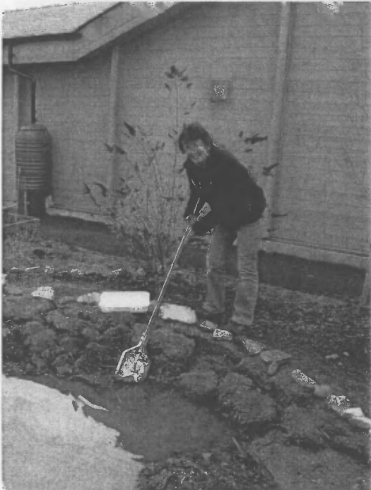
Sian yn dal 'slywod

plant. Mi fydd pawb yn cael eu rhoi mewn grwpiau o ddau neu dri. Bydd rhwyd, padell wen, llwy a photyn ar gyfer pob grwp, a phawb yn cymryd eu tro i roi'r rhwyd yn y dŵr a gwagu ei gynnwys i'r badell a sbio mewn rhyfeddod ar yr holl greaduriaid bach diarth sy'n cael eu dal.