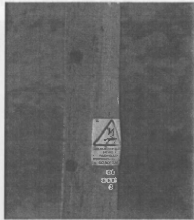
Ddarllenodd o ddim mo'r arwydd, mae'n amlwg!

Wrth ddynesu at Glan y Wern mi welsom alarch yn yr afon; bwncath yn cael ei erlid gan frain a chnocell fraith fwya yn diflanu i'r coed uwchben y tai. Croesi'r ffordd ger Pont Fuches Wen a dilyn yr afon heibio'r gwely hesg at hen ffordd Harlech. Dilyn y ffordd honno i'r chwith am ryw 150 llath a rhyfeddu at waith y cnocell fu'n tyllu polyn trydan yn y cae.