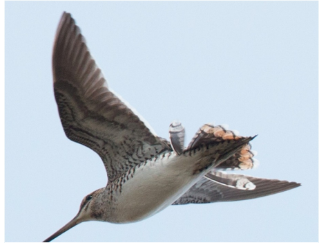
Mae cynffon unigryw y giach yn amlwg yn y llun