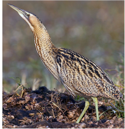
Aderyn y bwn

dan chwibanu a'r haul ar ei gefn symudliw, haid o gant a mwy o gwtiaid aur yn ei swancio hi yn eu plu haf, cornchwiglod yn ddigon â rhoi'r bendro i'r sadiaf ar ei draed wrth iddyn nhw fynd drwy'u campau, a'r gog i'w gweld a'i chlywed unwaith eto er gwaethaf pawb a phob pandemig.