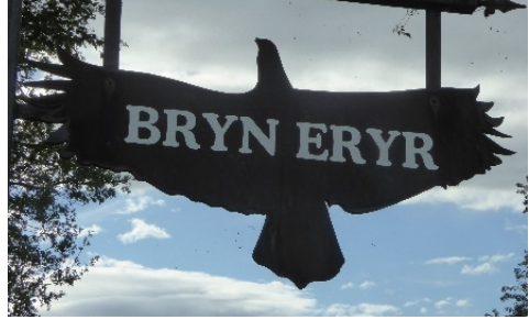
Ger Llanfihangel Glyn Myfyr

Ni cheir cofnod o eryrod yn magu yng Nghymru ers canol y 17 eg ganrif ac aderyn prin, er yn drawiadol, fyddai hyd yn oed ar ei fwyaf niferus rai canrifoedd cyn hynny. Ceir 82 o enwau lleoedd yn cyfeirio at eryrod a thybia awduron gwaith ymchwil